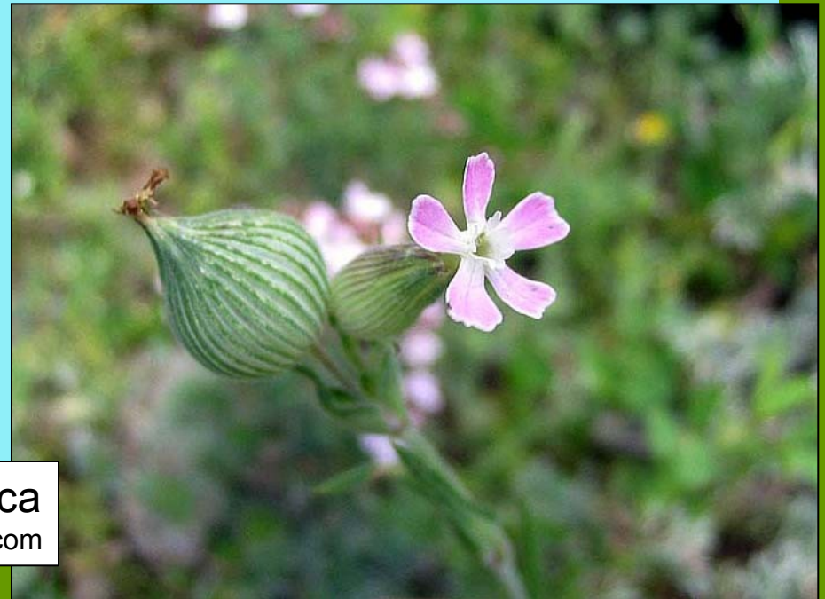
Silene conica