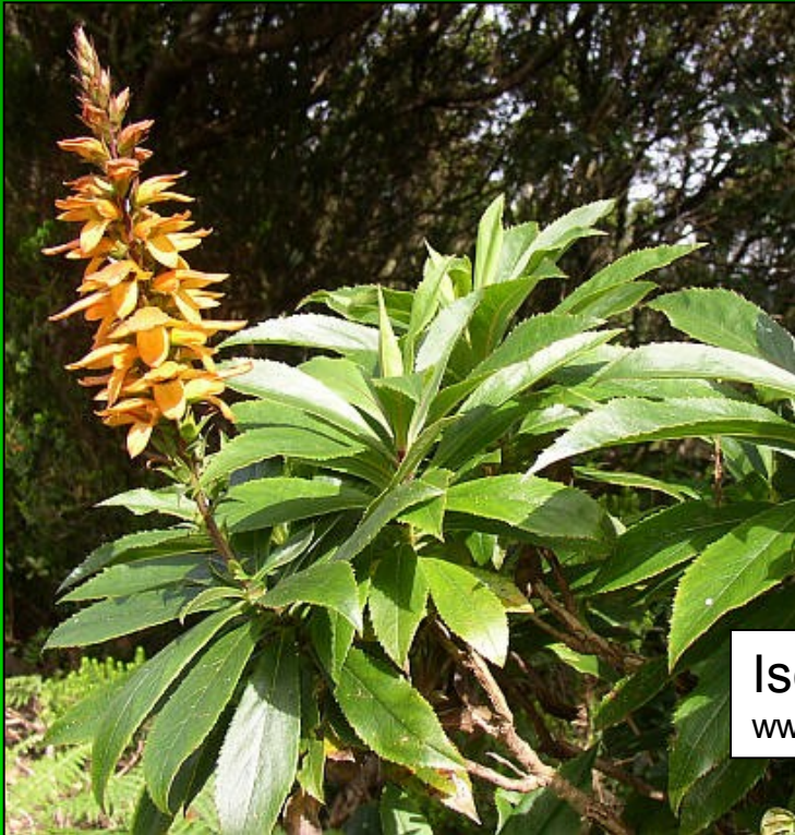
Isoplexis canariensis www.botany.cz