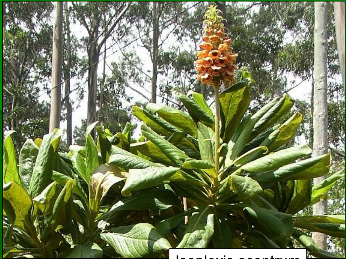
Isoplexis sceptrum www.botany.cz