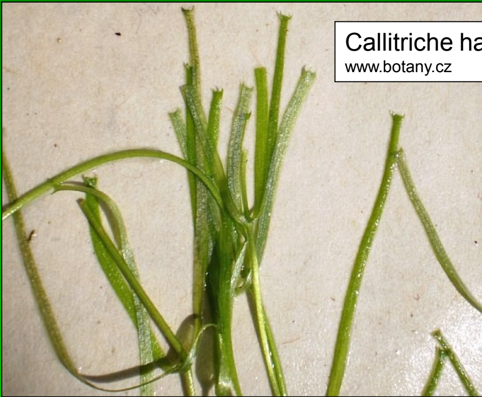
Callitriche hamulata www.botany.cz