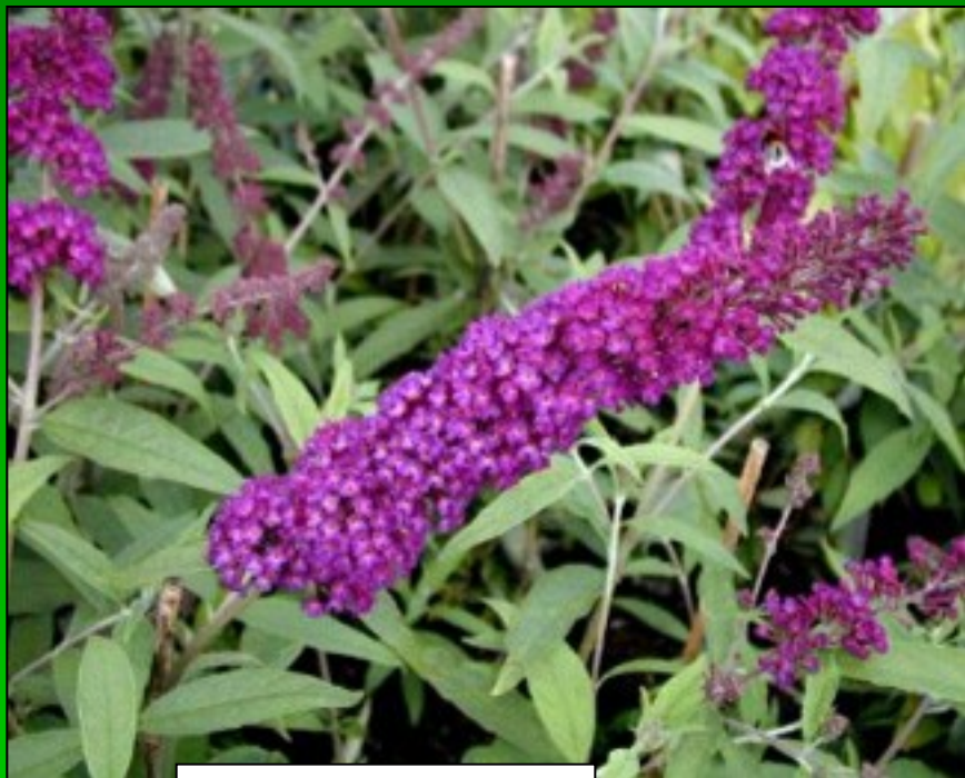
Buddleja davidii www.atlas-roslin.pl