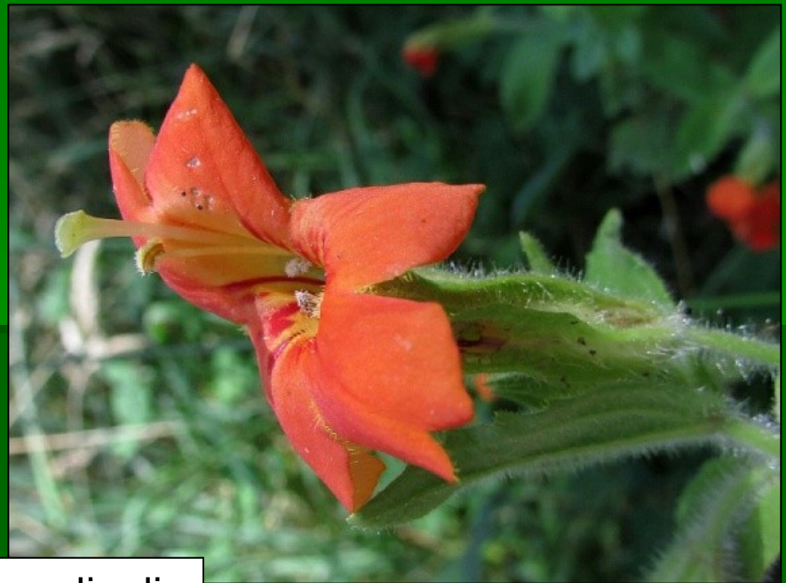
Mimulus cardinalis www.botany.cz