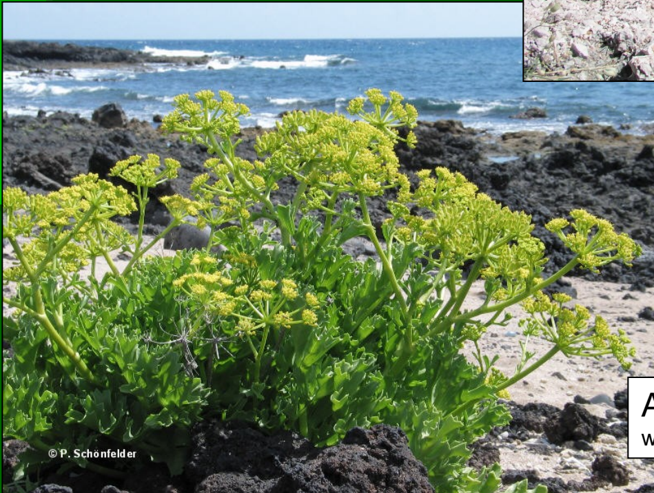
Astydamia latifolia www.biologie.regensburg-uni.de/