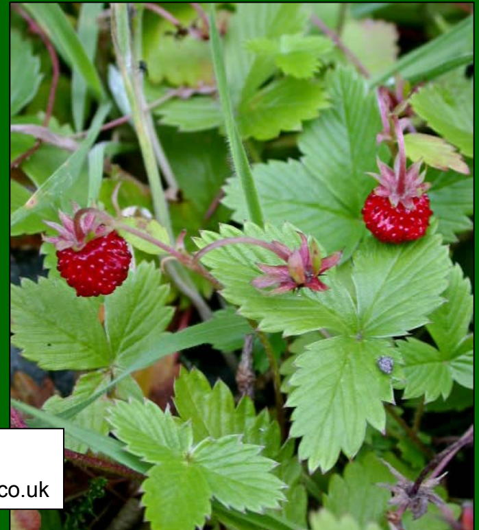
Fragaria vesca www.plant-identification.co.uk