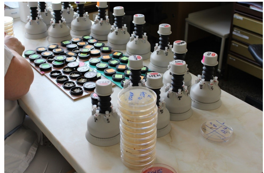
nanášení suspenze na Muller-Hintonův agar