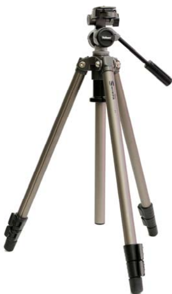
Obr. 2 Fotografický stativ

než je požadováno. Místo dálkové spouště lze ale využít i prostou samospoušť (časovač) aparátu.