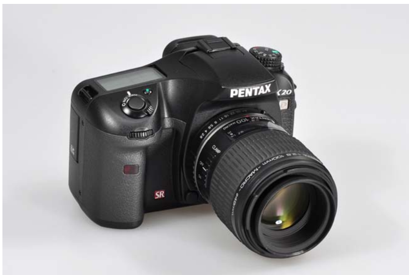
Obr. 1 DSLR Pentax K10D s makroobjektivem Pentax-D FA 100 mm f/2,8 MACRO.

Pro pořízení fotodokumentace v odpovídající kvalitě je doporučena nejlépe jednooká digitální zrcadlovka (DSLR) nebo pokročilý kompaktní fotoaparát, nejlépe s výměnnými objektivy (Obr. 1). Hlavními požadavky na fotoaparáty je možnost focení do formátu RAW nebo TIFF a možnost použití expozičních režimů s prioritou clony (A nebo Av) nebo plně manuálního expozičního režimu (M), výhodou je náhled scény na displeji (živý náhled - live view).