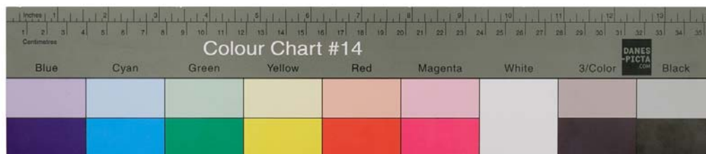
Obr. 3 Kalibrované barevné škály pro vyvážení barev