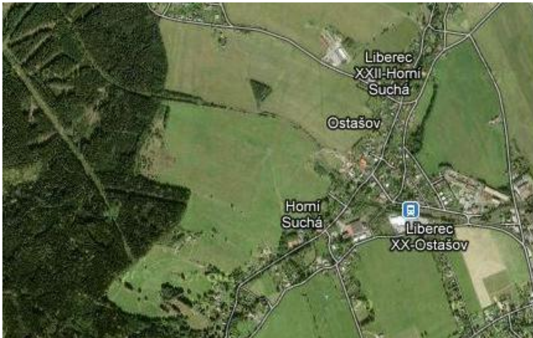
Obr. č. 1 – Lokalizace Horní Suché