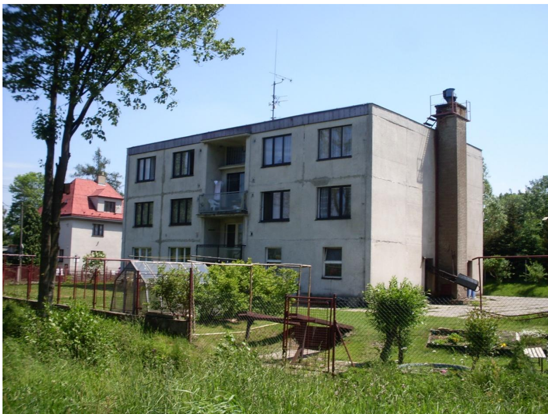
Obr. č. 5 – Menší panelový dům v Horní Suché