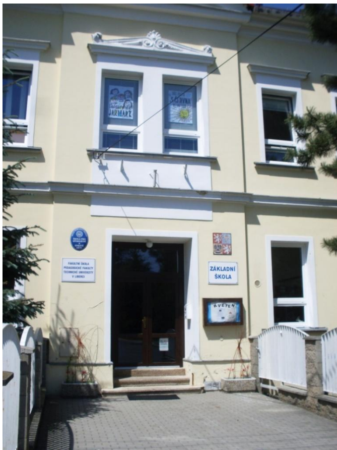
Obr. č. 6 – Fakultní škola Pedagogické fakulty TU v Liberci