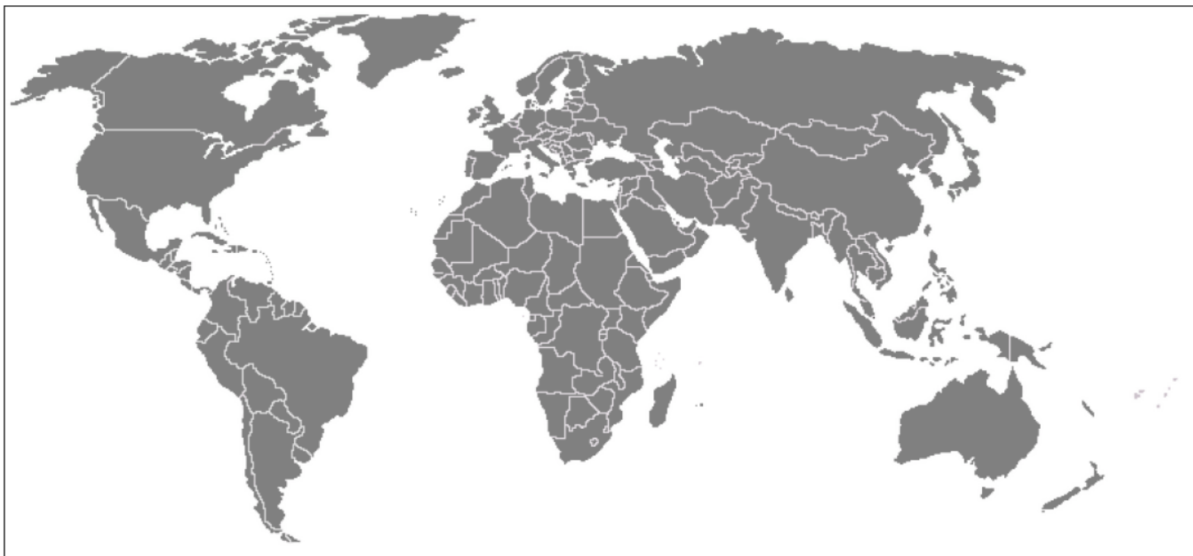
Obr. 1. Původ vybraných potravin v řetězci/obchodě...