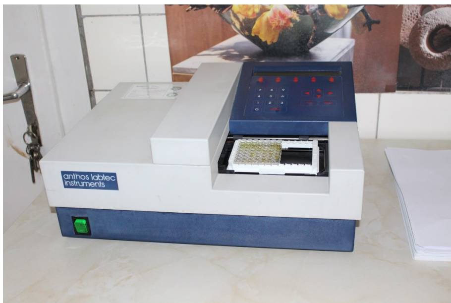
odečet na spektrofotometru