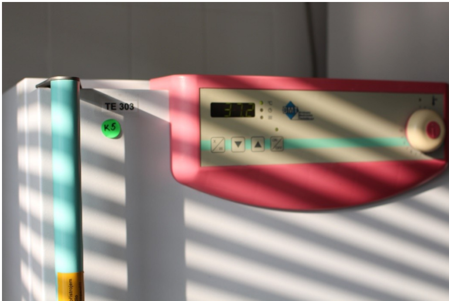
inkubace v termostatu