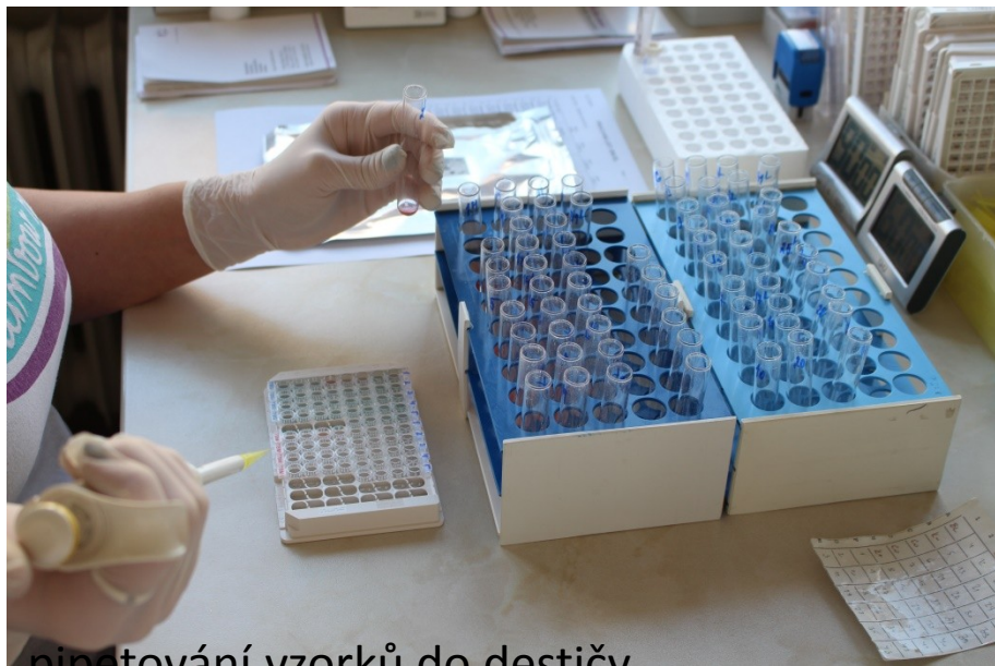
pipetování vzorků do destičky