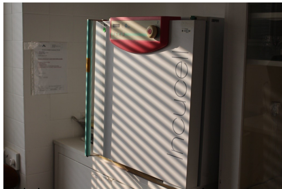
inkubace v termostatu