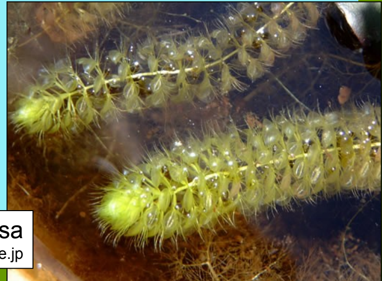
Aldrovanda vesiculosa www2.odn.ne.jp