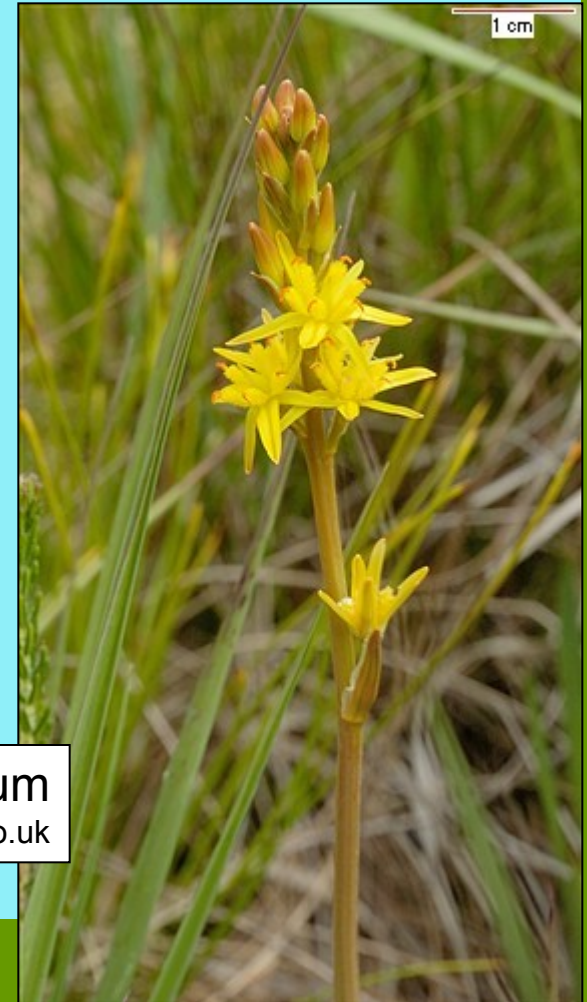
Narthecium ossifragum