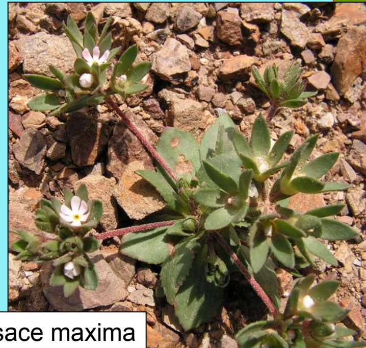
Androsace maxima www.ipe.csic.es