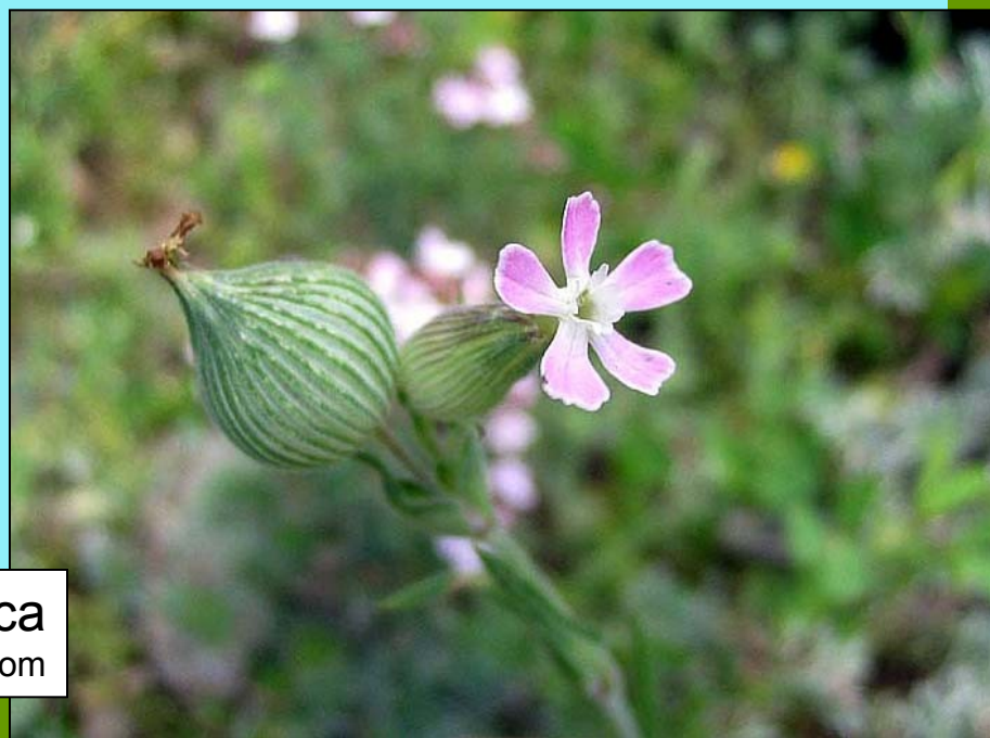
Silene conica