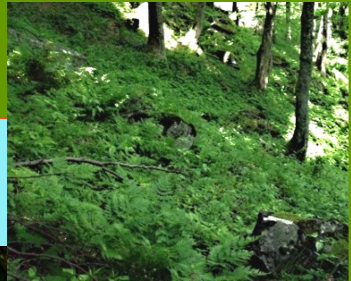
Cystopteris sudetica M. Kočí 2010