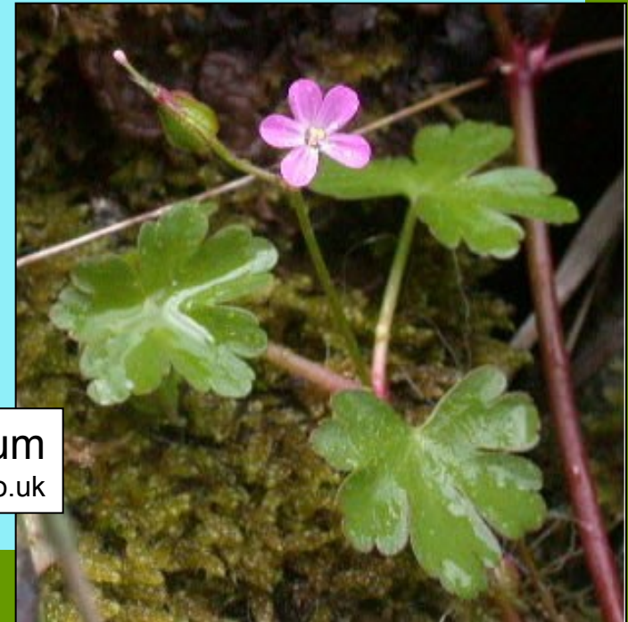
Geranium lucidum www.nature-diary.co.uk