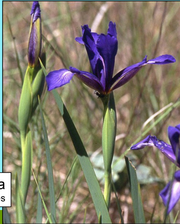
Iris spuria www.ipe.csic.es