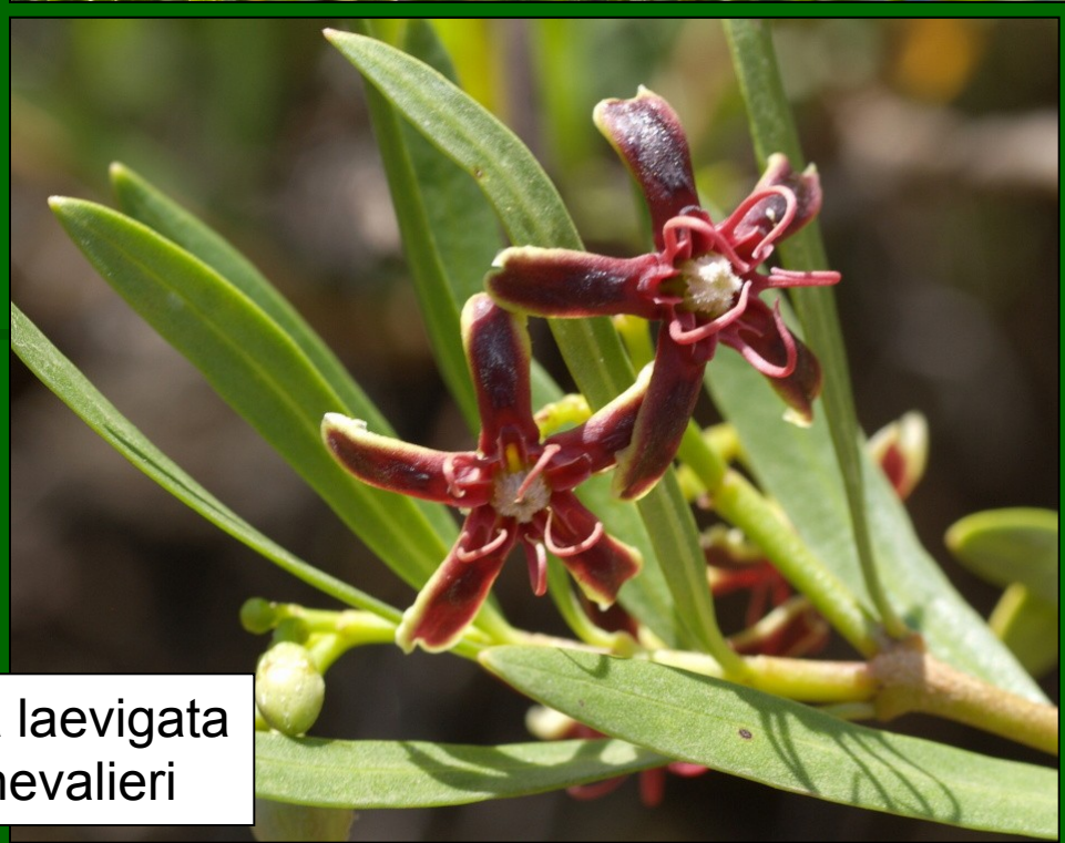
Periploca laevigata subsp. chevalieri