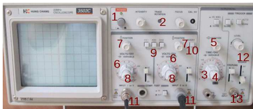
Obrázek B.2: Osciloskop Hung chang 3502C. Čísla označují umístění ovládacích prvků zmíněných v textu. Knoflíky 4 a 8 jsou umístěny ve středu přepínačů 3 a 6.

Většina osciloskopů dále obsahuje přepínač, kterým můžeme odstranit stejnosměrnou složku, pokud pro nás není zajímavá. Tento přepínač bývá označen DC/AC/GROUND. V poloze AC