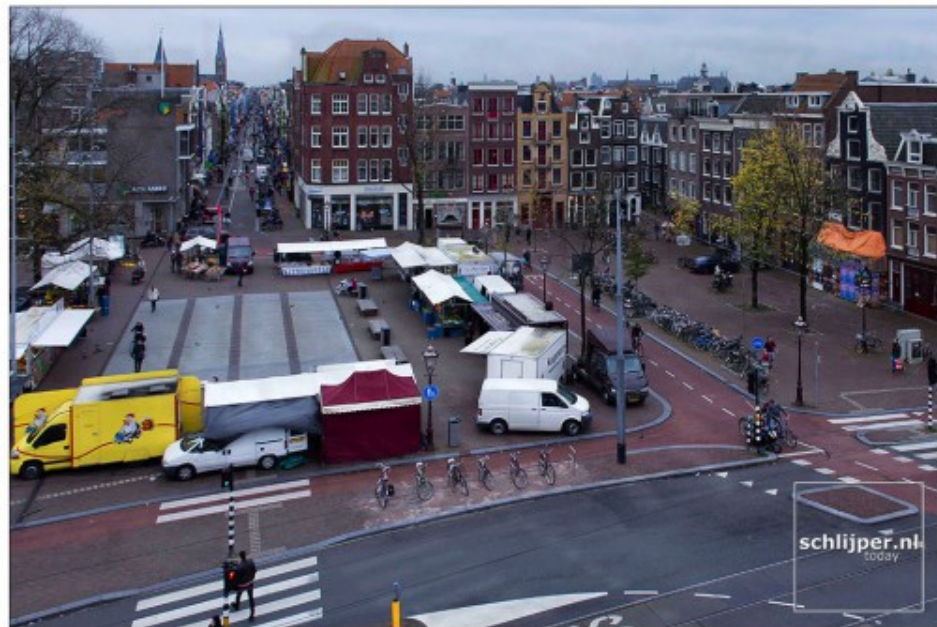
A project by @sustainableAMS & @schlijper