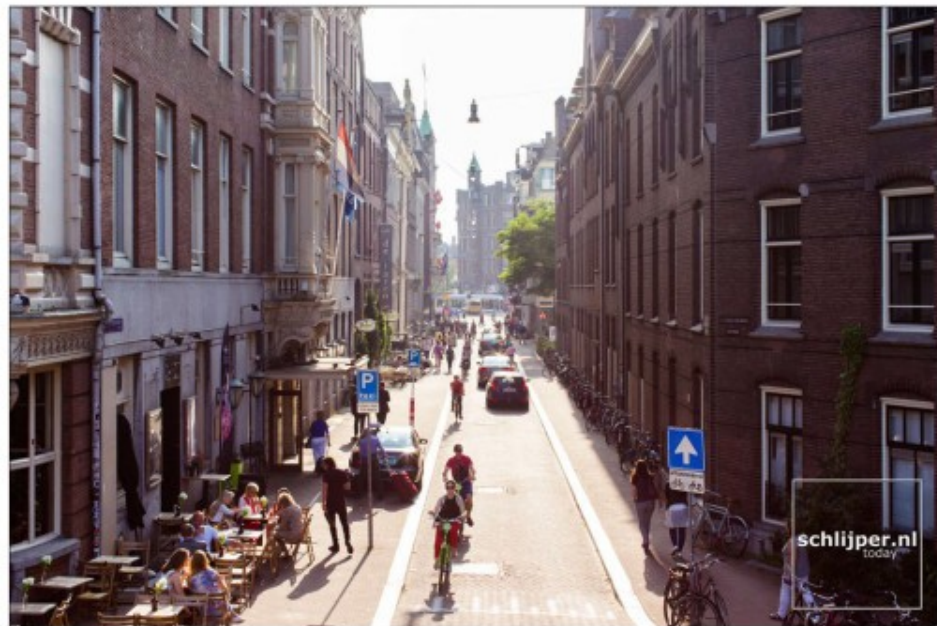
A project by @sustainableAMS & @schlijper