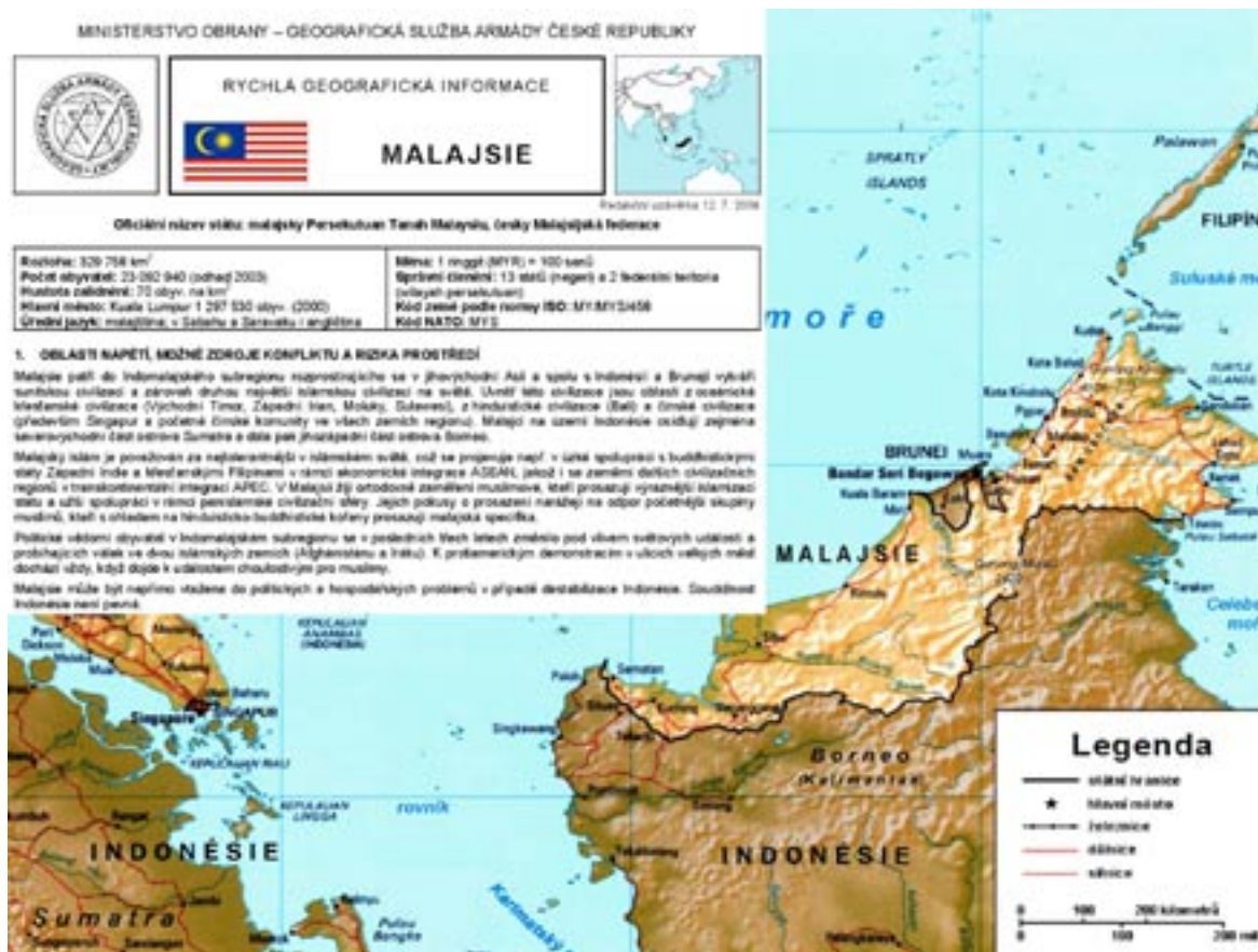
Obr. 14 Ukázka produktu Rychlá geografická informace

Obrovskou popularitu si získal produkt Rychlá geografická informace (RGI), který textovou a grafickou formou podává ucelené a co nejaktuálnější informace o konkrétní zemi.