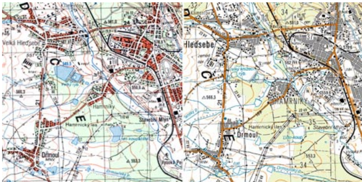
Obr. 10 Porovnání vzhledu topografických map měřítka 1 : 25 000 v systému S-42/83 a WGS84

vou databázi pro tvorbu TM 25 a TM 50 se stal aktualizovaný DMÚ 25 a pro tvorbu TM 100 nový Digitální model území 100 (DMÚ 100), který byl projektován pro tento účel a vytvořen na podkladě již hotových standardizovaných TM 50 s využitím DMÚ 200.