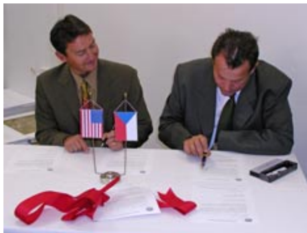
Obr. 23 Podpis předávacích protokolů při slavnostním předání tiskových strojů

Výsledkem těchto aktivit a spolupráce byly mj. společná měřická kampaň specialistů VTOPÚ a USA (NIMA) při definování systému WGS84 na území ČR v roce 1992, úzká spolupráce s firmou ESRI (USA) při budování digitálního produkčního systému ústavu nebo zapojení ústavu do projektu tvorby VMap1. Nemalou zásluhu na technicko-technologickém rozvoji dobrušského zařízení měla finanční pomoc vlády USA, tzv. Varšavská iniciativa. V rámci tohoto projektu byly na přelomu tisíciletí dodány technologie v hodnotě cca 115 milionů korun.