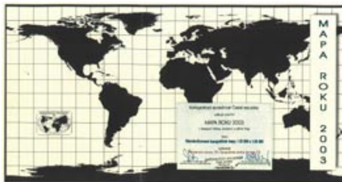
Obr. 11 Ocenění Mapa roku 2003

Důkazem, že se v Dobrušce podařilo vytvořit kvalitní produkční systém tvorby map včetně přípravy personálu je ocenění Mapa roku 2003, které ústav obdržel za standardizované topografické mapy 1 : 25 000 a 1 : 50 000 od Kartografické společnosti České republiky.