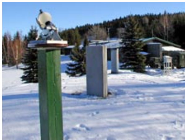
Obr. 16 Odloučené pracoviště Polom, v pořadí zleva pilíř s heliografem, pilíř s anténou referenční stanice GPS a pilíř geodetické komparační základny, v pozadí hlavní budova observatoře

Změna společenských poměrů po roce 1989, zrušení monopolního postavení armády v oblasti snímkování v roce 1991, možnost bezproblémového odchodu vojáků z povolání z resortu a reforma (zejména snižování počtů) armády způsobily, že došlo k postupnému rozpadu secvičených fotogrammetrických osádek a ke snižování schopnosti letectva zabezpečovat odborné úkoly služby leteckými snímky. Mimo jiné i z tohoto důvodu byla na přelomu století zahájena meziresortní spolupráce s Českým úřadem zeměměřickým a katastrálním (ČÚZK) na projektu společného snímkování a tvorby ortofot, jehož první cyklus byl zahájen na jaře roku 2003 a ukončen na konci roku 2005. Na konci roku 2005 byla zahájena příprava spolupráce při druhém cyklu projektu v letech 2006–2008. (Pozn. autora – Bližší informace k projektu jsou uvedeny ve VGO č. 2, 2005).