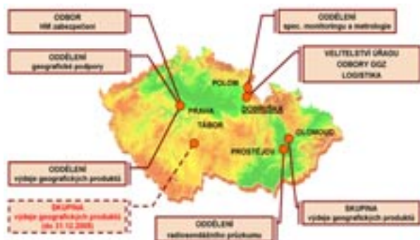
Obr. 4 Aktuální dislokace VGHMÚř

Odbor hydrometeorologického zabezpečení s podřízenými Oddělením hydrometeorologického zabezpečení, Oddělením distančních měření s odloučeným pracovištěm Povětrnostní radiosondážní skupina v Prostějově, Oddělením komunikačních systémů a Oddělením technické a logistické podpory.