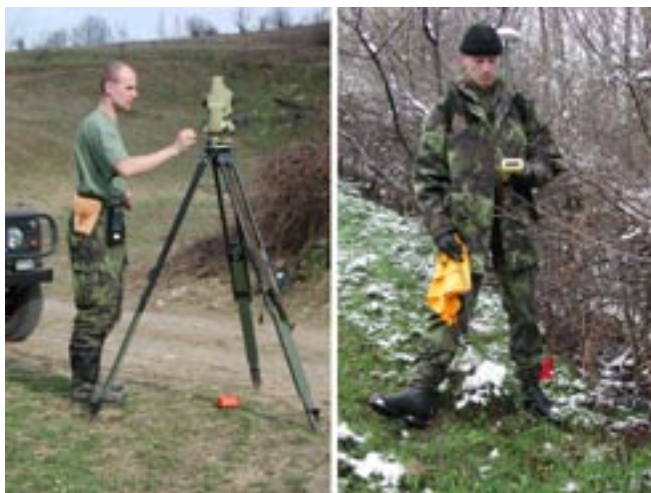
Obr. 7 Dobrušští geodeti při asanaci vojenské střelnice v Bosně a Hercegovině

Od poloviny devadesátých let minulého století se vojenští geodeti významnou měrou podíleli na provádění pyrotechnických asanací v bývalých vojenských výcvikových prostorech formou vytyčování čtverců pro evidenci asanovaných území. Tento úkol byl v roce 2002 úspěšně plněn i v Bosně a Hercegovině při asanaci bývalé vojenské střelnice.