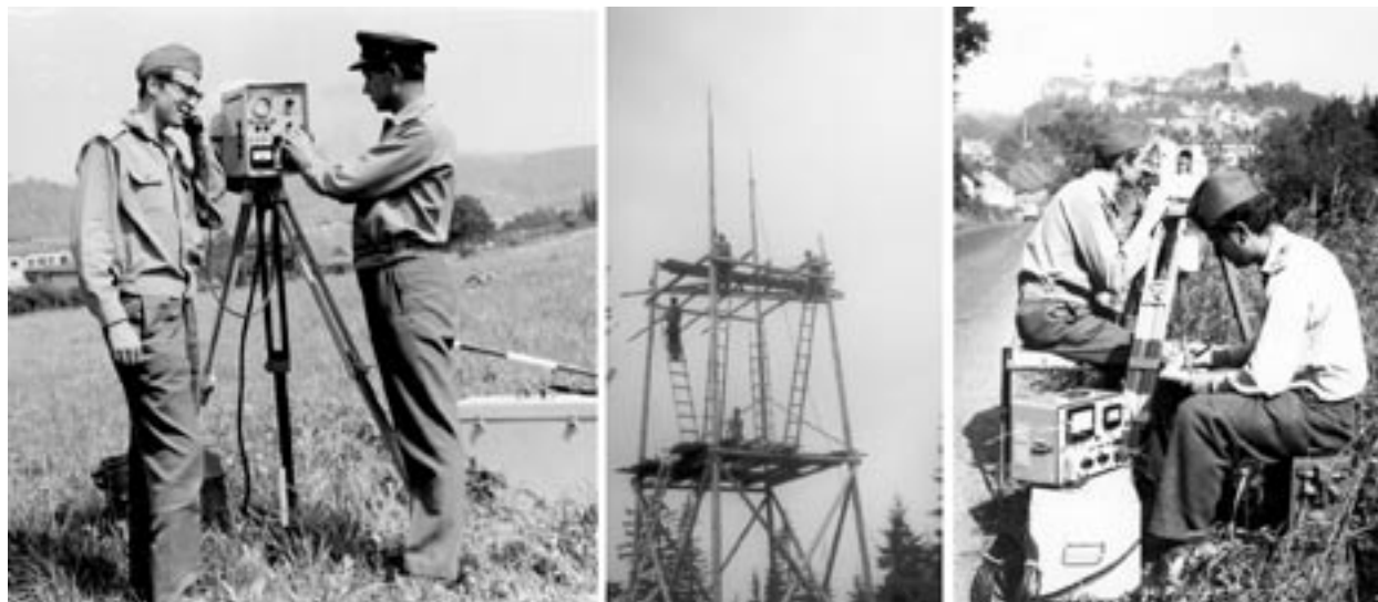
Obr. 6 Měřické práce při budování geodetických základů

Vedle podílu na zavedení souřadnicových systémů se dobrušští specialisté při mezinárodní a meziresortní kooperaci podíleli na definování systémové tížnicové odchylky a tvorbě kvazigeoidu pro území ČSR, na měření základny kosmické triangulace a novém měření délek stran astronomicko-geodetické sítě, na projektování nadřazené sítě a dopplerovském měření, na přípravě astronomicko-geodetických a gravimetrických dat pro 2. souborné vyrovnání Jednotné astronomicko-geodetické sítě (JAGS) v S-42/83, na výstavbě a modernizaci čs. geodetických a gravimetric-