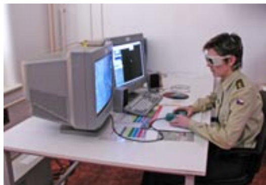
Obr. 13 Fotogrammetrické vyhodnocení LMS

Dalším krokem na poli spolupráce států NATO v oblasti tvorby digitálních geografických databází je zapojení do Multinational Geospatial Co-production Program (MGCP), jehož řešení bylo zahájeno v roce 2005. Cílem je vyrobit celosvětovou geografickou datovou bázi obsahem odpovídající měřítku mapy 1 : 50 000, přičemž úřad zabezpečuje zpracování dat z 12 segmentů o rozměrech 1^\circ \times 1^\circ .