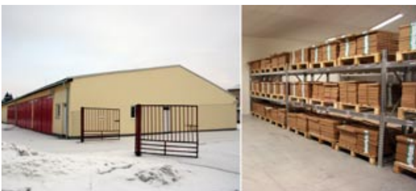
Obr. 5 Centrální sklad map v Dobrušce – budova a uložení map

Postupně byla realizována rovněž skartace vyřazovaných mapových produktů a ukončen provoz výdejny map v Táboře, rekonstrukce výdejny map v Olomouci a zahájena rekonstrukce prostorů úřadu v budově Rooseveltova 23 v Praze za účelem zřízení nové výdejny a přestěhování dosavadní výdejny z objektu MO ČR v Praze na Válech. V souvislosti s vybudováním centrálního skladu map v Dobrušce bude do konce roku 2006 ukončena činnost skladu v Praze-Ruzyni.