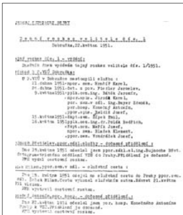
Obř. 1 Kopie výřezu první strany denního rozkazu velitele 2. VZÚ č. 1/1951, který vyšel tři týdny po vzniku ústavu

Rozhodnutí o přenesení vojenské geografie do Dobrušky bylo podloženo dvěma důvody. Jednak možností využít uvolněný objekt kasáren pevnostních praporů tehdejší československé armády, praporů určených k obsazení budovaného řetězce pohraničních opevnění proti potenciální agresi, jednak podle tehdejších hledisek vhodnou a výhodnou polohou města (jak se v následujících letech ukázalo, hledisek správných a dodnes platných).