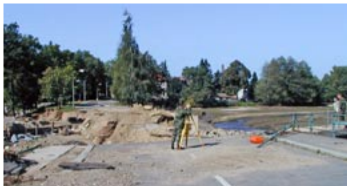
Obr. 8 Geodetické zabezpečení výstavby ženiných mostů při operaci OBNOVA 2002

V roce 2000 bylo zahájeno systematické geodetické zaměřování a zpracování údajů o výškových objektech na základě požadavků VZÚ při správě Registru výškových objektů (RVO), zejména pro potřeby vydávání speciálních map s leteckou nadstavbou. Úkol aktualizace evidence výškových překážek byl v rámci 4. obnovy topografických map plněn péčí topografů ústavu při tehdejší aktualizaci Letecké orientační mapy 1 : 200 000. Tím vznikla tzv. Banka dat výškových překážek (BDVP), která byla spravována ve VZÚ a později byla přejmenována na RVO. V souvislosti s reformou služby byla na jaře roku 2003 působnost a zodpovědnost za správu registru přenesena do Dobrušky.