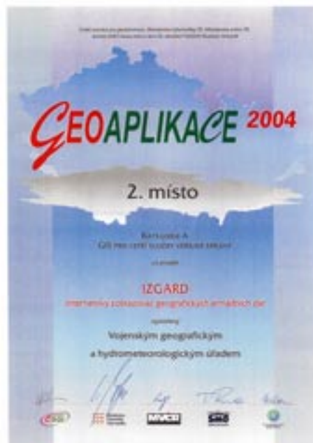
Obr. 21 Ocenění za 2. místo v soutěži Geoaplikace roku 2004, který obdržel produkt IZGARD

V dobrušském zařízení pracovali či s ním spolupracovali a nové generace vynikajících zeměměřičů vychovávali špičkoví specialisté, uznávaní nejen v armádě, ale i v odborných komunitách v republice či na mezinárodní úrovni.