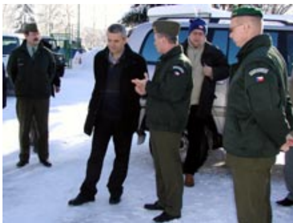
Obr. 18 Z návštěvy ministra obrany JUDr. Karla Kühnla na pracovišti Polom

Díky prokázaným schopnostem zachytit, rychle vyhodnotit a poskytnout informace o ničivých zemětřeseních se stanice Polom dostala do povědomí nejen odborné veřejnosti. Důkazem byla návštěva ministra obrany České republiky JUDr. Karla Kühnla za přítomnosti veřejných sdělovacích prostředků v únoru roku 2005.