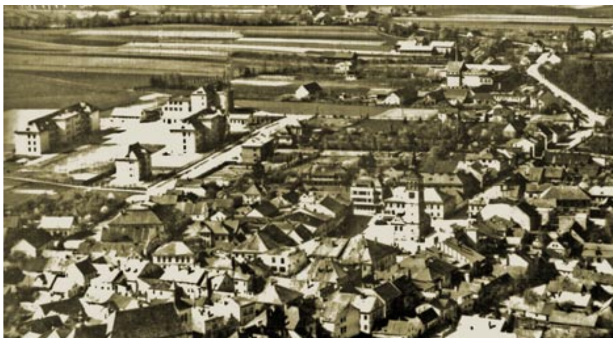
Obr. 2 Dobruška a dobušská kasárna v padesátých letech minulého století

Od samého počátku byly v Dobrušce plněny úkoly v oborech geodézie, geofyziky, topografie a mapování, fotogrammetrie, leteckého měřického snímkování, správy archivu leteckých měřických snímků a správy a údržby hraničního operátu. Všechny úkoly sem přešly z VZÚ Praha spolu s geodety, topografy, fotogrammetry a řadou dalších vojáků z povolání a s odpovídající technikou, podklady a archivy.