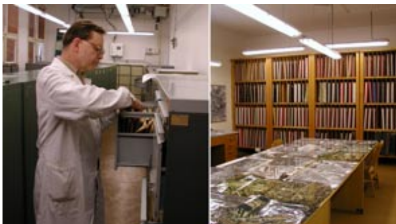
Obr. 15 Pracoviště archivu leteckých měřických snímků

K problematice mapování neodmyslitelně patří letecké měřické snímkování. Po celou dobu existence dobrušského útvaru byla vytvořena úzká vazba s letectvem naší armády a jeho pracovišti vyčleněnými pro tento účel (fotoletecké skupiny), která po dlouhá léta zabezpečovala letecké měřické snímkování pro potřeby aktualizace mapového díla i pro účely speciální (zpracování dokumentace vojenských letišť, snímkování vojenských výcvikových prostorů, vodních toků apod.) Výsledkem spolupráce je mj. unikátní archiv leteckých měřických snímků z území České republiky, pořizovaných od roku 1936.