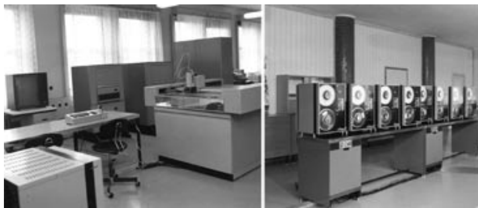
Obr. 19 Počátky „digitálního věku“ – pracoviště DIGIKART

Činnost dobrušského zařízení byla po celou dobu jeho existence podporována výzkumnou činností. Dobrušští specialisté byli vždy průkopníky zavádění nových a moderních metod, techniky, technologií a myšlenek ve všech oblastech a oborech nějakým způsobem se dotýkajících problematiky zeměměřičtví. Ve všech obdobích dokázali „jít s dobou“, v některých oblastech ji dokázali i předběhnout.