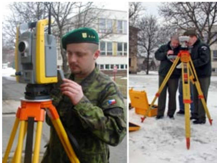
Obr. 9 Totální stanice Trimble S6 a GPS přijímač Trimble R8

Nepřehlédnutelnou kapitolou v historii dobrošské vojenské geografie je problematika Global Positioning System (GPS) a zavádění měřické techniky a technologií fungujících na bázi GPS. Specialisté VTOPÚ od samého počátku sledovali vývoj této problematiky a byli u zavádění prvních přístrojů do naší armády, kterými byly geodetické aparatury GPS GEOTRACER 100 od firmy Geodimeter, pořízené v roce 1992. Vysokou technickou a odbornou připravenost personálu dokládá praktické nasazení těchto zařízení pro definici geodetického systému WGS84 na území ČR na podzim téhož roku při kampani VGSN-92.