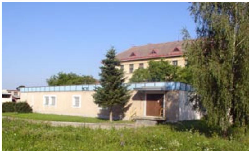
Obr. 3 Budova tiskárny

Tradiční působnost dobrušského zařízení v oboru vojenské geografie byla v letech 2001–2004 rozšířena o nové oblasti. Během přípravného období reorganizace Topografické/Geografické služby v letech 2001–2003, kdy bylo rozhodnuto o zrušení VZÚ Praha a přenesení části jeho působnosti do Dobrušky, bylo současně rozhodnuto vybudovat ve VTOPÚ kartopolygrafický provoz jako náhradu za zrušenou tiskovou kapacitu VZÚ (tiskárna VZÚ byla v roce 2003 předána AVIS Praha).