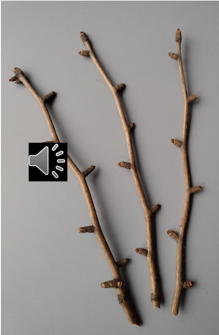
větvička s brachyblasty