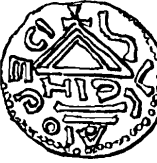
Boleslav I. č. 1-15