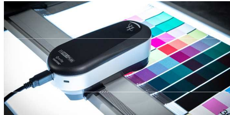
Obr. 4: Kalibrační zařízení