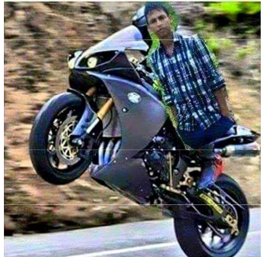
Obr. 2: Jak (ne)editovat bitmapovou grafiku