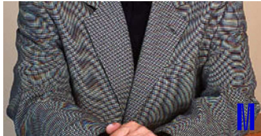
Obr. 5: Moaré v obrázku