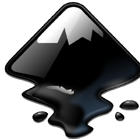
Obr. 2: Logo Inkscape