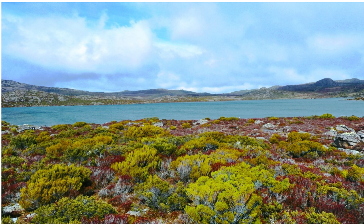
Bezejmenné jezero – Lake Nameless leží na zarovnaném povrchu ve výšce 1200 m n.m. Patří k nejhůše položeným větším jezerům, již nad hranicí lesa.