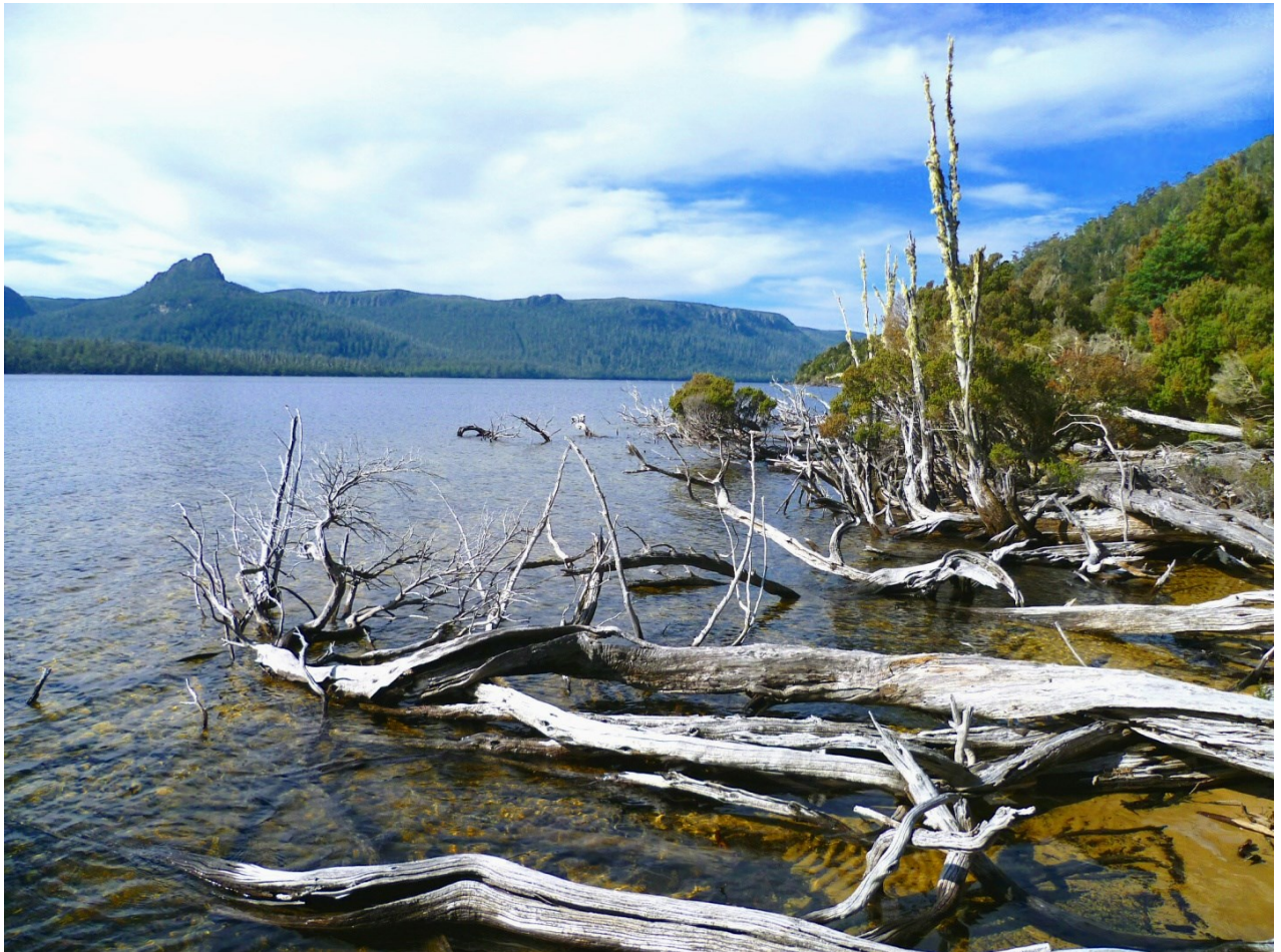
Jezero St. Clair, hladina v 739 m, uměle mírně zvýšena, hloubka až 167 m. Jezero bylo vyhloubeno dlouhým údolním ledovcem.