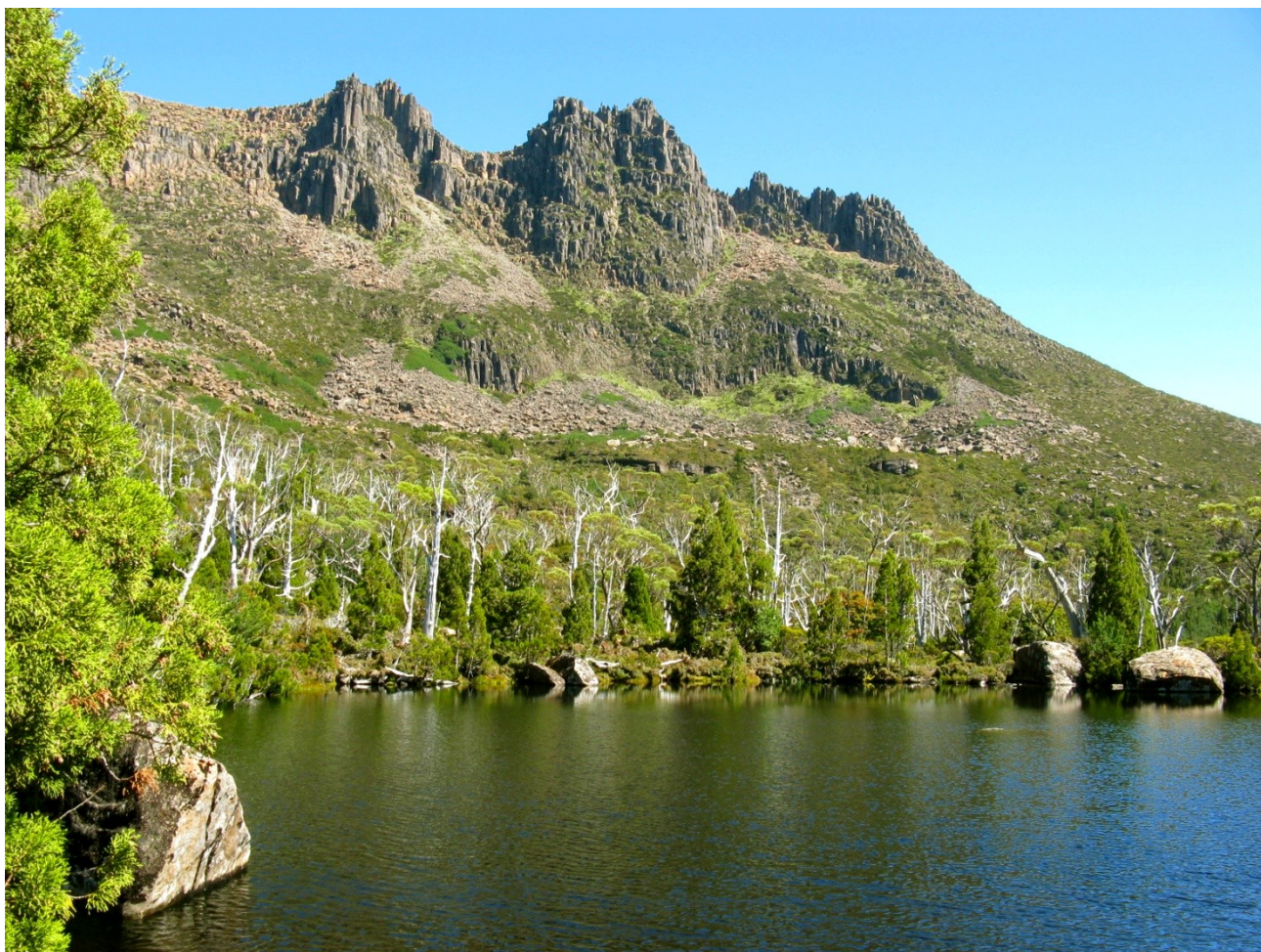
Jezírko pod východní stěnou nejvyšší hory Tasmánie - Mt. Ossa. Jezírko leží ve výši 1136 m, Mt. Ossa měří 1617 m.