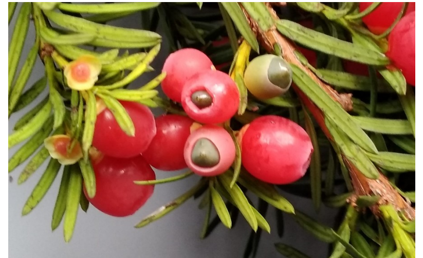
epimacia se zralými semeny