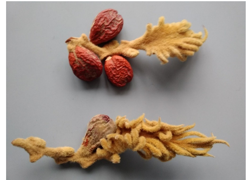
megasporofyl se zralými semeny