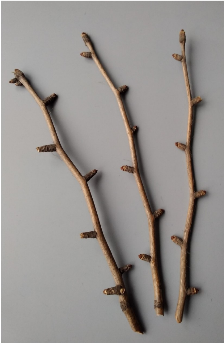
větvička s brachyblasty