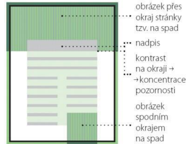
Obr. 2: Sazební zrcadlo