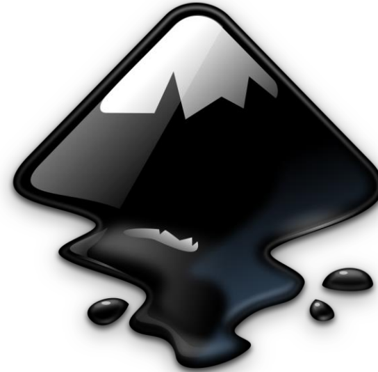
Obr. 2: Logo Inkscape