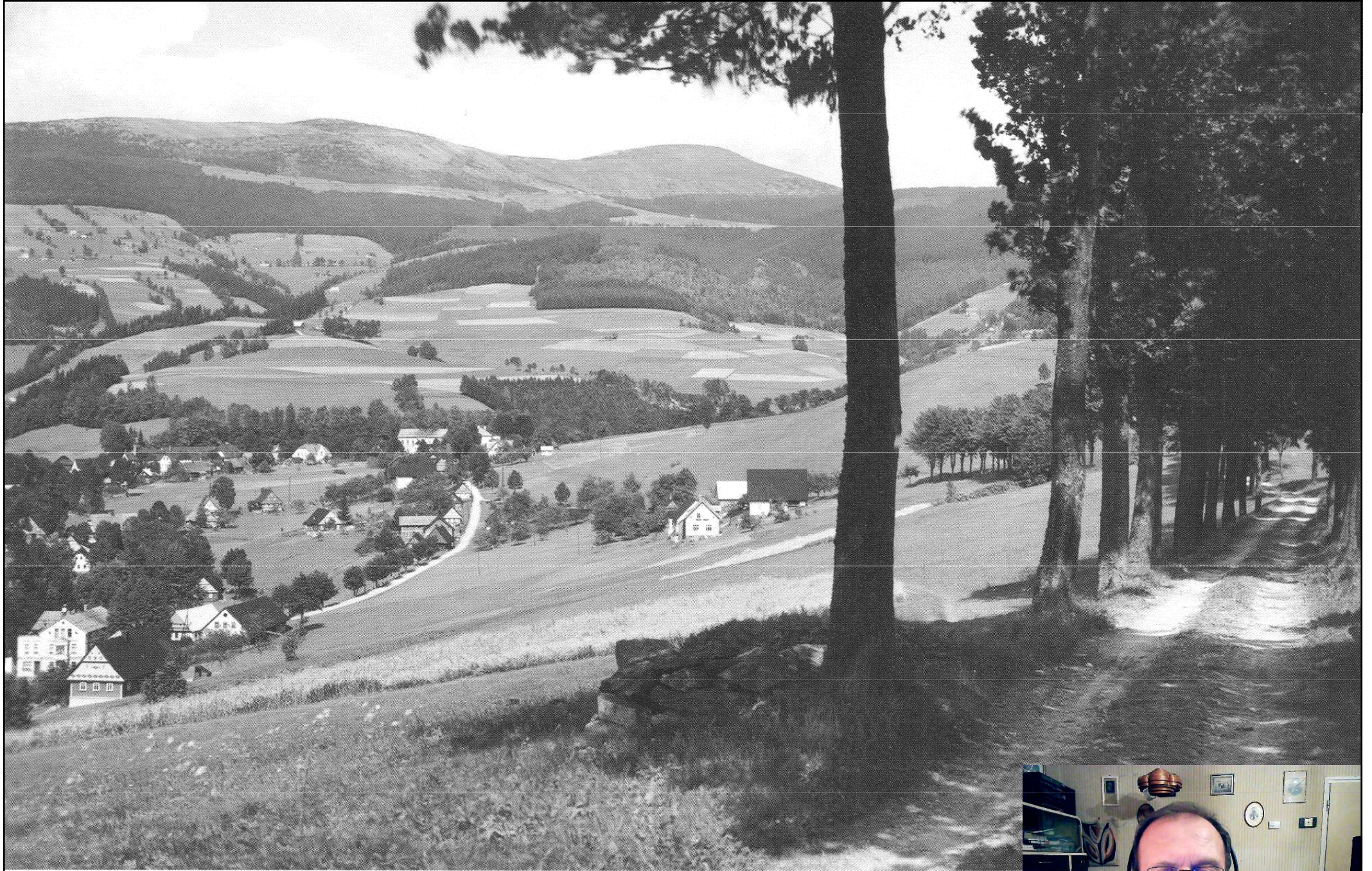
Walter Staudte, •1938, AA

1938 - Rokytnice nad Jizerou – alej.