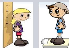
Výška a váha