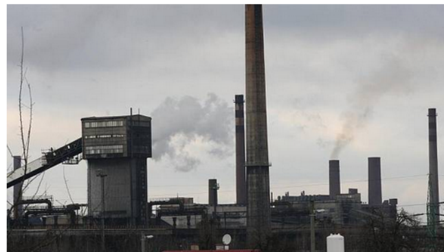
ArcelorMittal Ostrava.

Ostrava - Nejen znečištěné ovzduší trápi obyvatele žijící v okolí hutního gigantu ArcelorMittal Ostrava. Nepříjemný a zdraví ohrožující je také hluk. Limity huť významně překračuje. Na krku má kvůli tomu i žalobu.