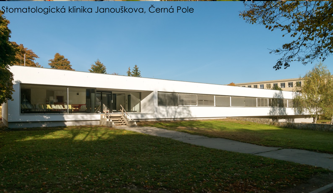
Stomatologická klinika Janouškova, Černá Pole