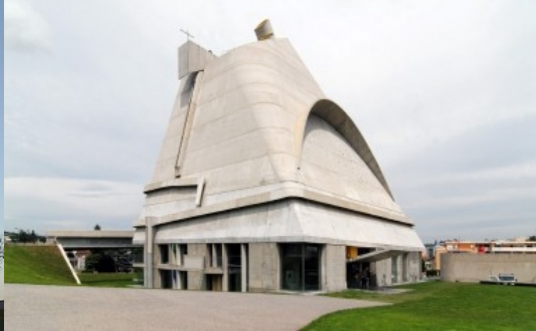
Kostel sv. Petra, 2006