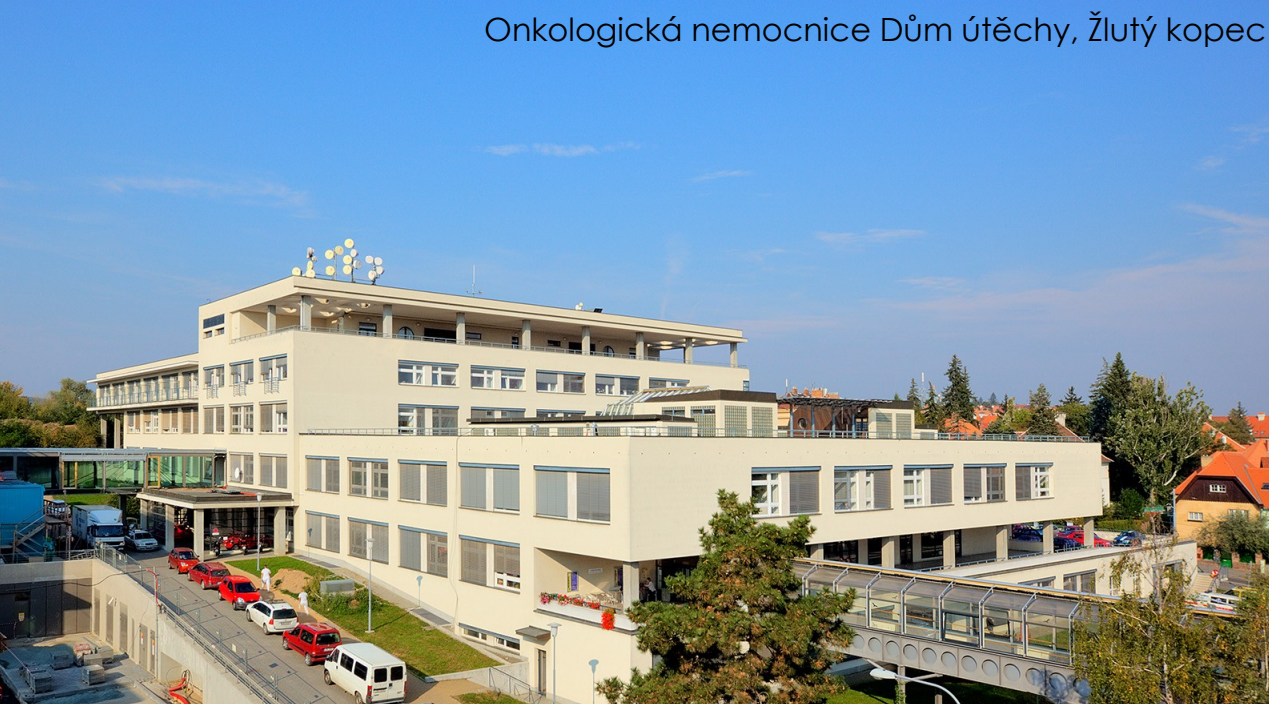
Onkologická nemocnice Dům útěchy, Žlutý kopec