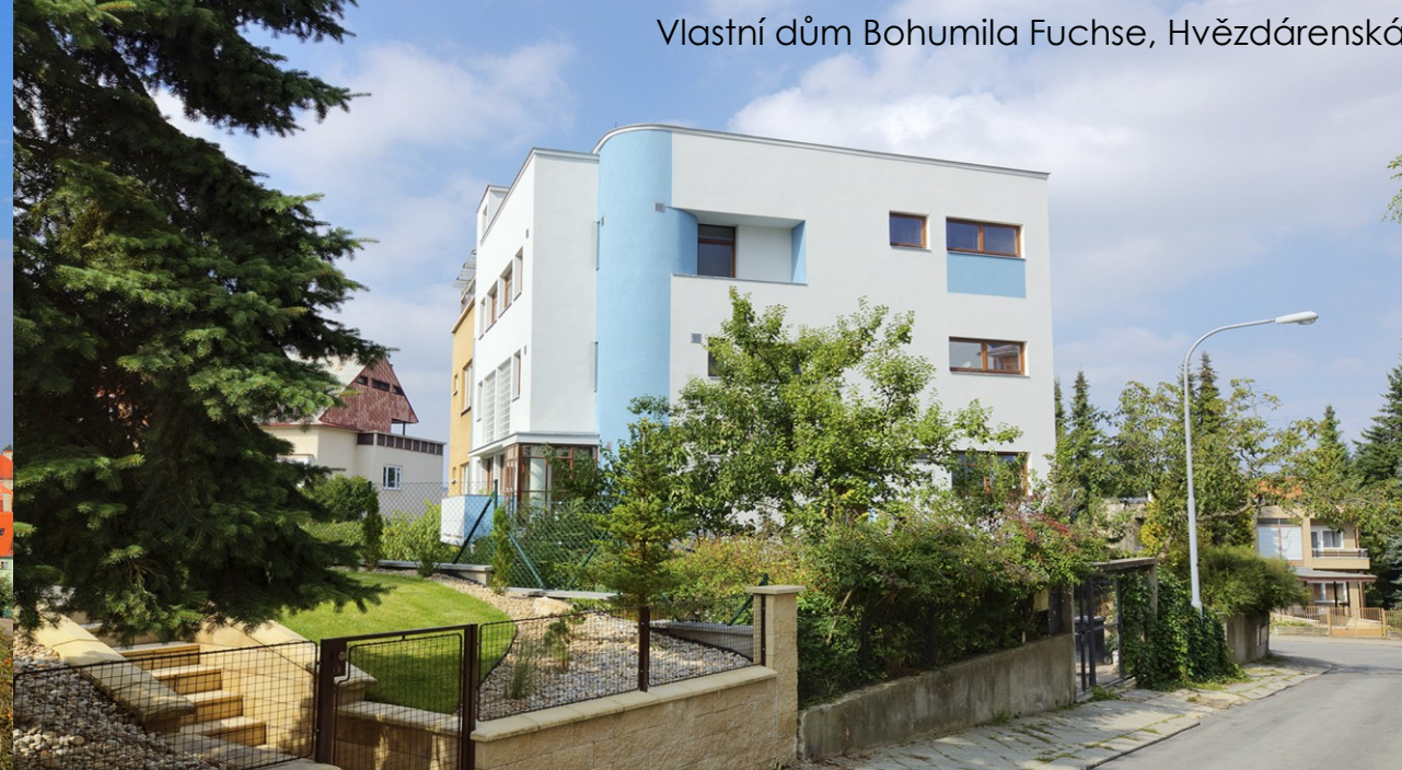
Vlastní dům Bohumila Fuchse, Hvězdárenská