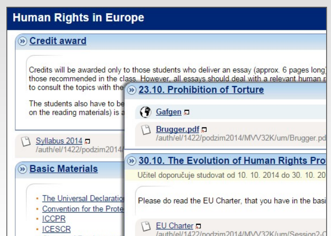
📌 V interaktivní osnově jsou pro studenty k dispozici podklady ke kontaktní výuce