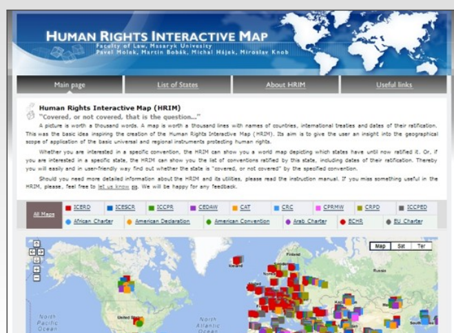
📌 Výuková pomůcka - Interaktivní mapa lidských práv