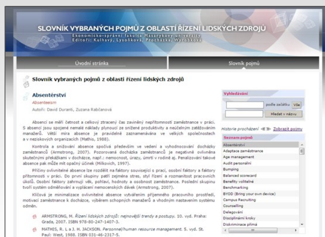
Slovník vybraných pojmů z oblasti řízení lidských zdrojů