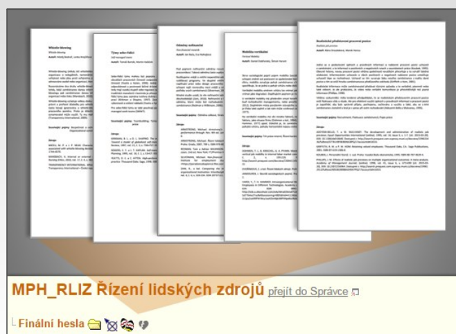
Jednotlivé pojmy studenti odevzdávají do odevzdávárny k oponování