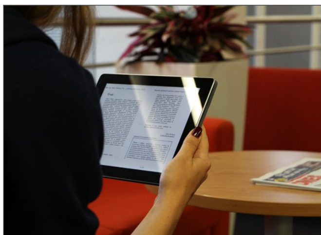
Slovník si mohou stáhnout i do svých mobilních zařízení